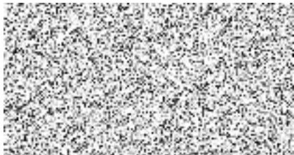
CEZ Distribuce, a. s.